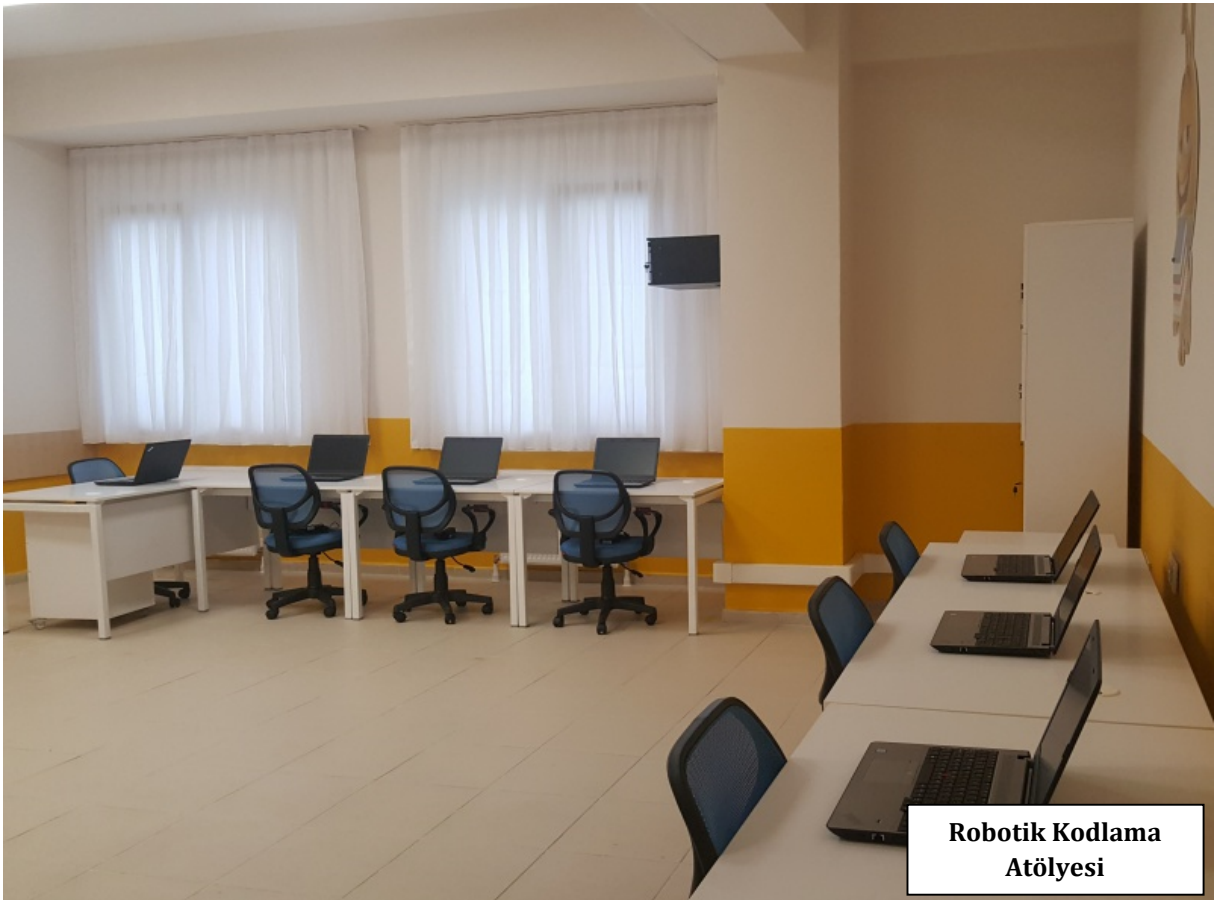
Robotik Kodlama Atölyesi