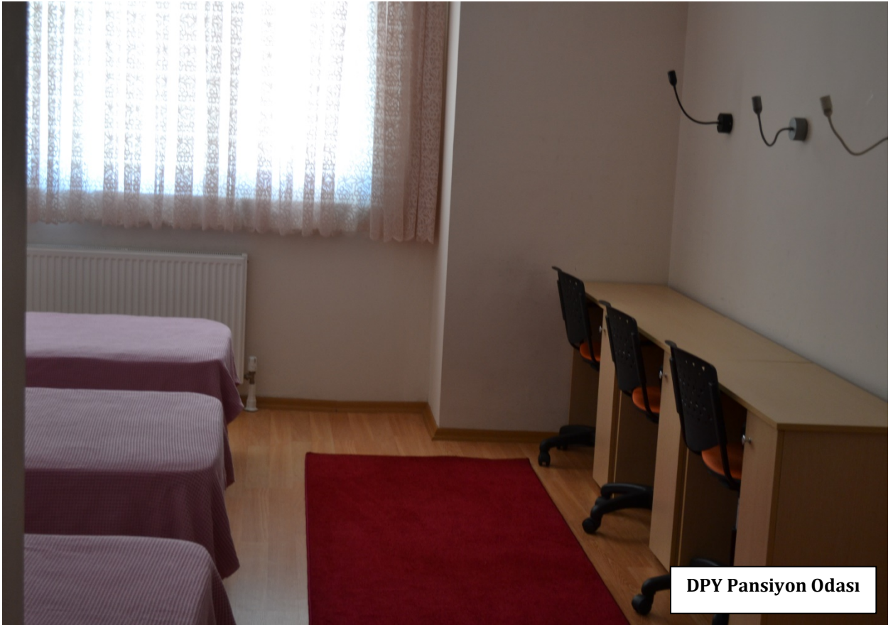
DPY Pansiyon Odası