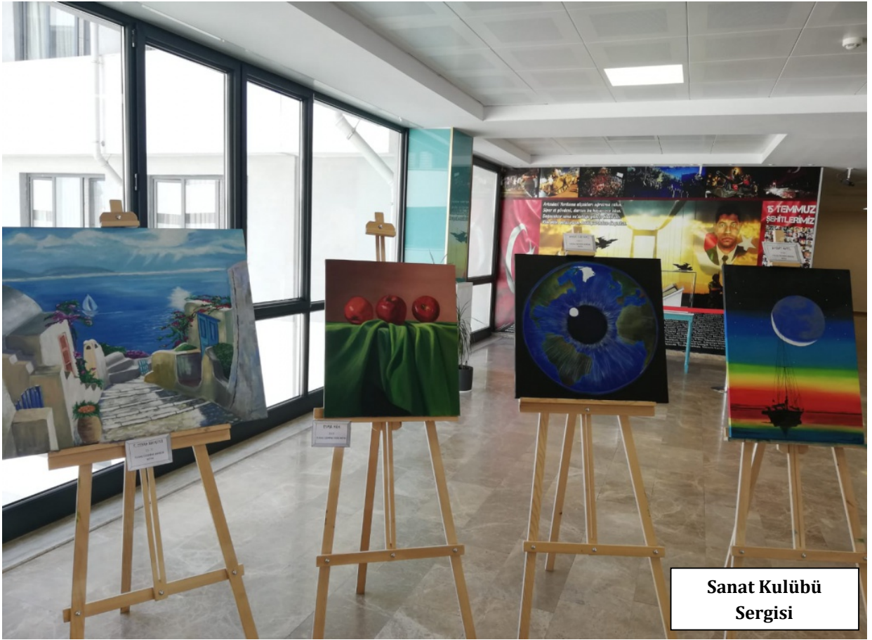
Sanat Kulübü Sergisi