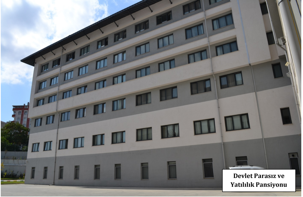
Devlet Parasız ve Yatılılık Pansiyonu